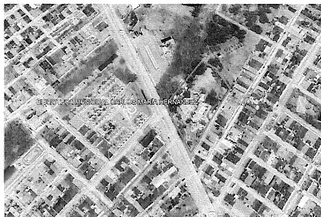
Localización 1.1- Lugar de intervención- municipio de Acacias